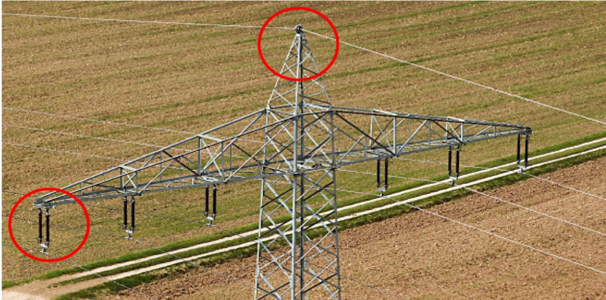
Abbildung 6: Bsp. Isolatorkette an Traverse und Blitzschutzseil an der Mastspitze