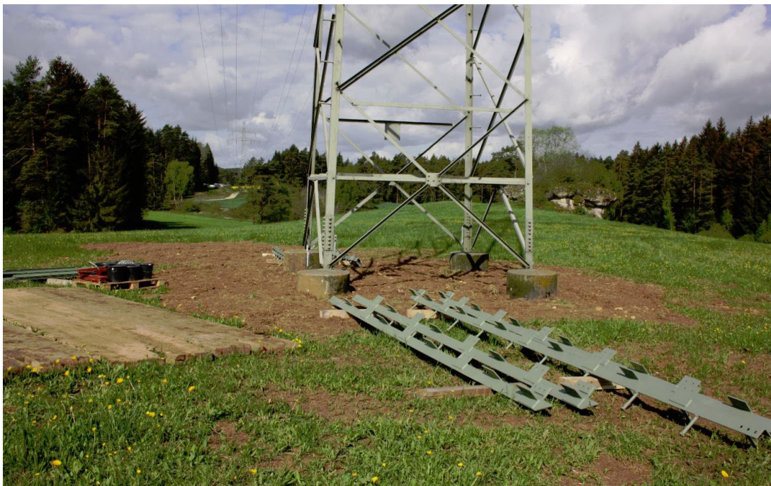
Abbildung 10: Mastverstärkungsteile mit Arbeitsfläche

Gegen Korrosion sind die Stahlteile für Freileitungen bereits nach der Fertigung im Werk feuerverzinkt und mit einem farbigen Beschichtungssystem versehen (Werksbeschichtung). Dabei werden schwermetallfreie und lösungsmittelfreie Beschichtungen eingesetzt.