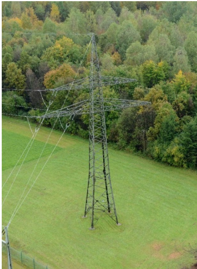
Abbildung 5: Bsp. Donaumast (Abspannmast)