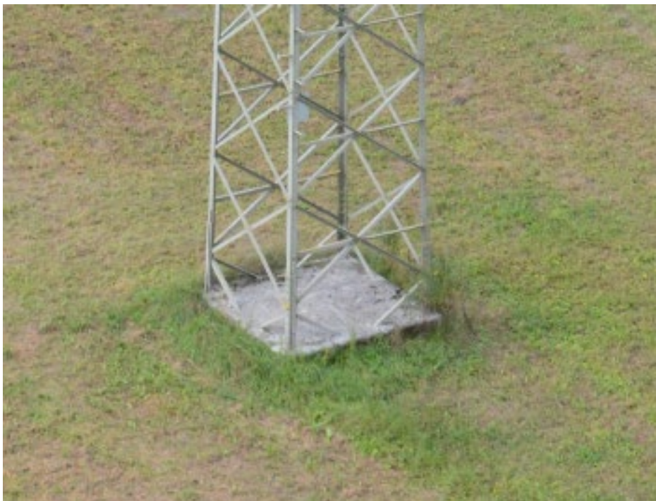
Abbildung 3: Blockfundament