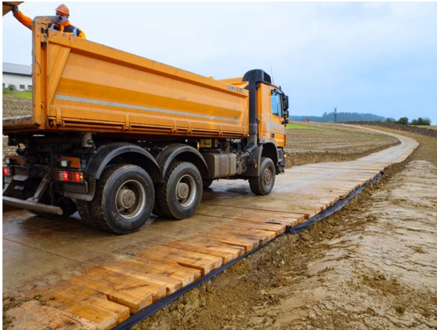
Abbildung 12: Bsp. Zuwegung über Holzplatten