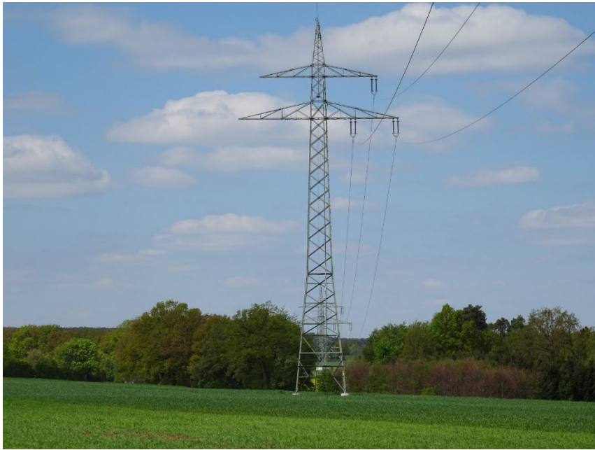
Abbildung 4: Bsp. Donaumast (Tragmast)