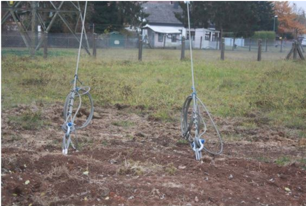
Abbildung 8: Bsp. im Boden eingebrachte Abankerungen

entsorgt. Sollte der Platz hierfür nicht ausreichend vorhanden sein, erfolgt der Rückbau des Mastes in Teilstücken / Schüssen.