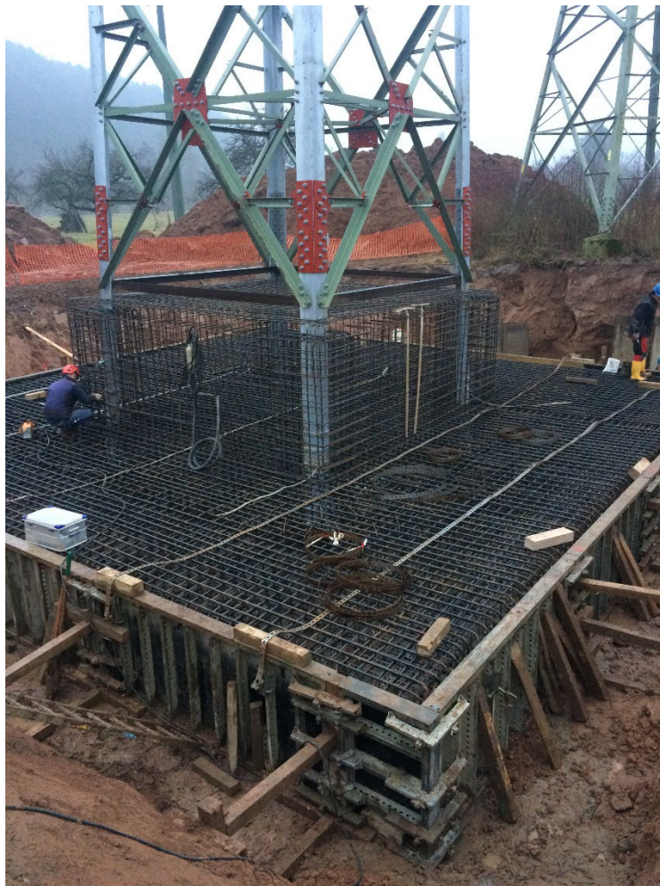
Abbildung 9: Beispiel für Fundamentarbeiten, Schalung und Bewehrungsstahl