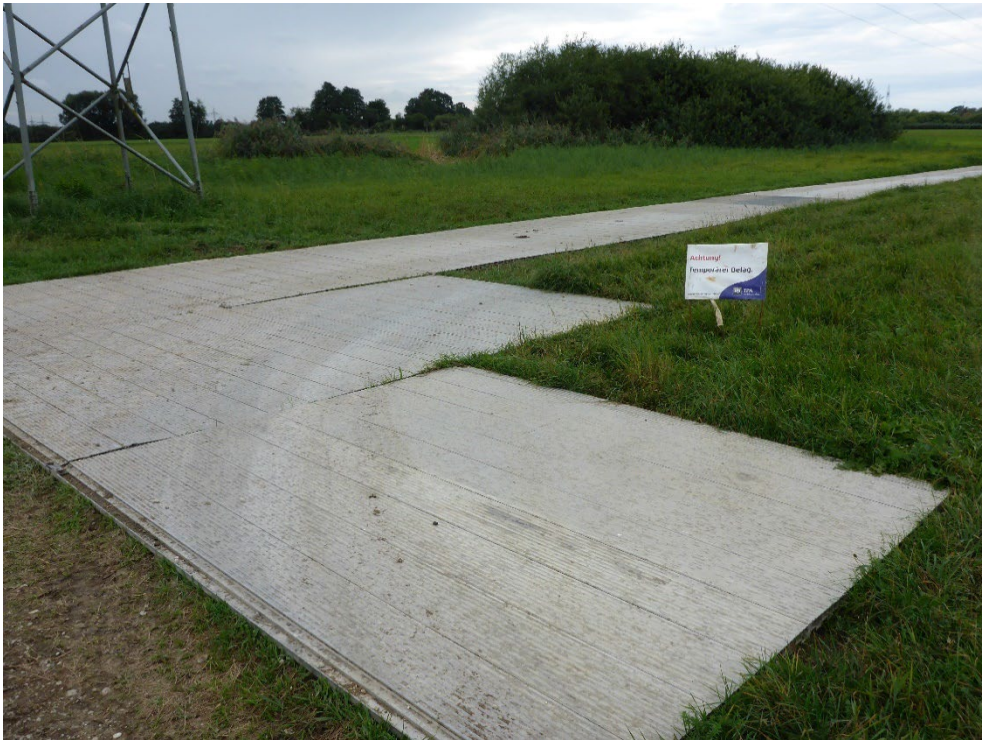
Abbildung 11: Bsp. Zuwegung über Aluplatten

bis zur nächsten öffentlich gewidmeten Straße sind im Lageplan mit Maßnahmen (Anlage 2 - 4) und im Rechtserwerbsplan (Anlage 5 - 2) dargestellt.