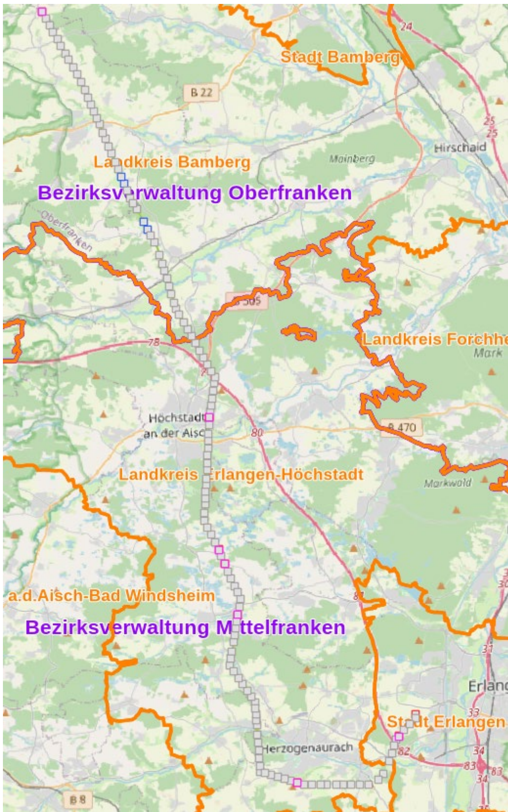
Abbildung 1: Trassenverlauf