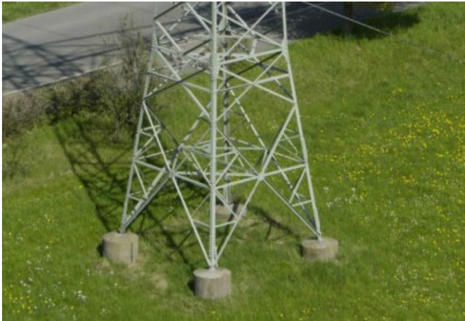
Abbildung 2: Fundamentköpfe